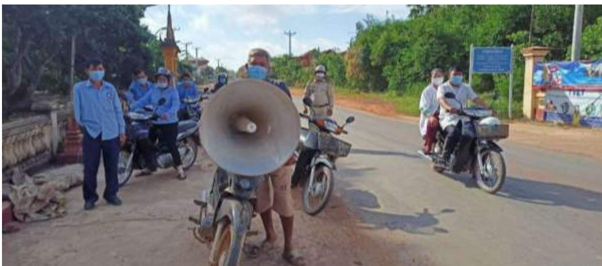
សកម្មភាពសកម្មភាព អប់រំផ្សព្វផ្សាយនៅខេត្តពោធិសាត់ ក្រចេះ រតនគិរី និងស្ទឹងត្រែងខែកក្កដា ឆ្នាំ២០២១